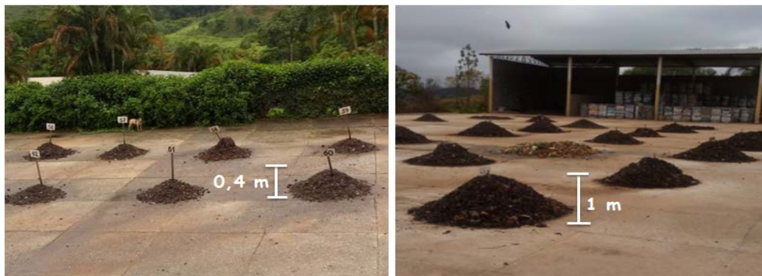
Figura 3: 1 Pilhas de compostagem com dimensões inadequadas (ano 2016)

De maneira geral observou-se a incapacidade técnica para realizar o processo e continuar com sua manutenção, como, por exemplo, na montagem das pilhas (ou poderiam ser leiras) de compostagem, em que foi observado que na maioria dos casos elas não tinham tamanho (ou volume) adequado, segundo os critérios recomendados pela FEAM (Figura 3).