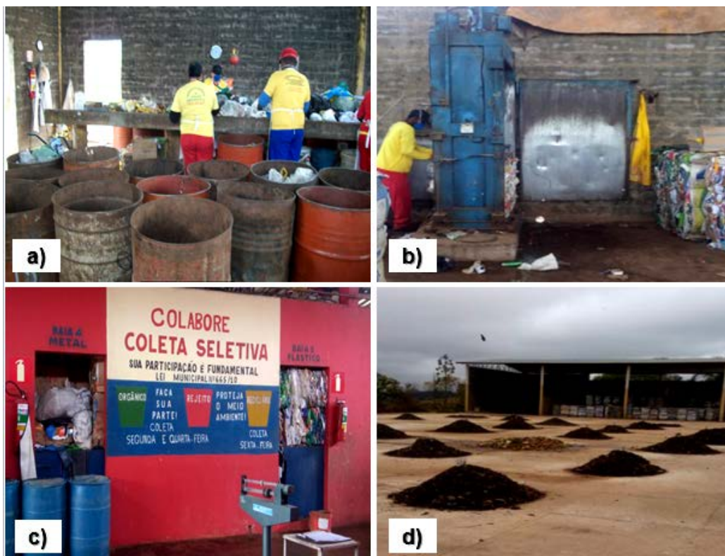
Figura 1 a) Área de triagem com mesa de catação em concreto; b) Área de prensagem do material com prensa hidráulica típica; c) Baias para armazenamento dos recicláveis; d) Pátio de compostagem impermeabilizado (ano de 2016)

Considerando os municípios analisados, nota-se que as unidades atendem particularmente as cidades de pequeno porte no Estado, sendo que 72 % (43) delas possuem população total de até 10.000 habitantes e portanto apenas 27 % (17 cidades) possuem população maior que 10.000 habitantes. Muito em função disso, as unidades instaladas em Minas Gerais são simples, com infraestrutura básica e apresentam um layout ou projeto padrão pouco diferenciado e adaptado a cada realidade.