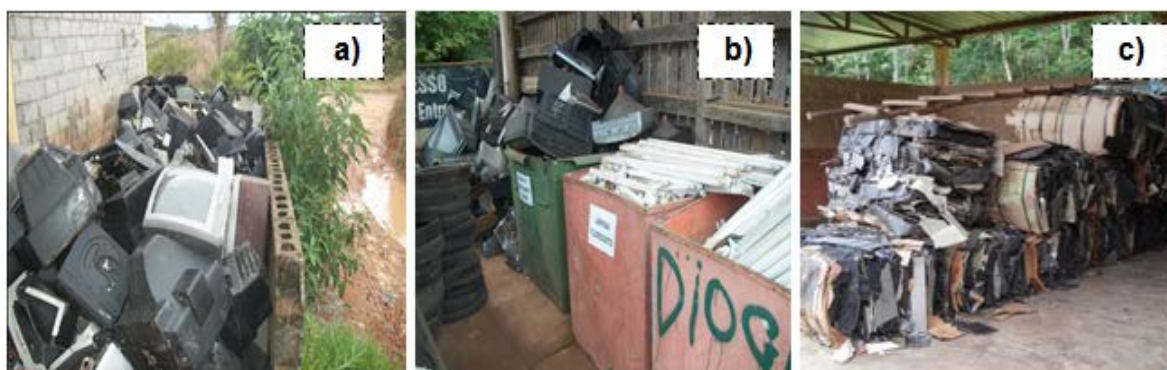
Figura 2: a) Disposição inadequada de REE; b) Armazenamento incorreto de resíduos Classe 1 – lâmpadas fluorescentes; c) Fardo de plástico provenientes de desmonte de REE

Curiosamente, em alguns casos, observou-se a realização de algum desmonte manual das partes de TV de tubos e de outros REE e a separação, dos vidros e do plástico, do restante dos componentes eletrônicos (Figura 2). Nem mesmo o enfardamento desses plásticos, na tentativa de possibilitar a venda ou mesmo a doação desse material para reciclagem, teve resultado satisfatório.