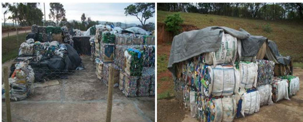
Figura 4: Fardos de recicláveis dispostos em pátio a céu aberto (notar a precariedade das condições de cobertura)

Assim, com mais de 10 anos de instalação destas unidades, verifica-se que parte das UTC em Minas Gerais não atende completamente as necessidades locais. Outra parte delas apresenta alguma estrutura danificada, como trincas, rachaduras, ou ainda, necessidade de pintura. Tudo isso lhes confere uma imagem de descuido, o que nem sempre é verdade, pois muitas vezes a manutenção das estruturas se faz através de improvisos por falta de recursos.